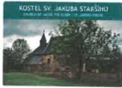
KOSTEL SV. JAKUBA STARŠÍHO