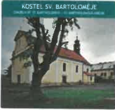
KOSTEL SV. BARTOLOMEJE